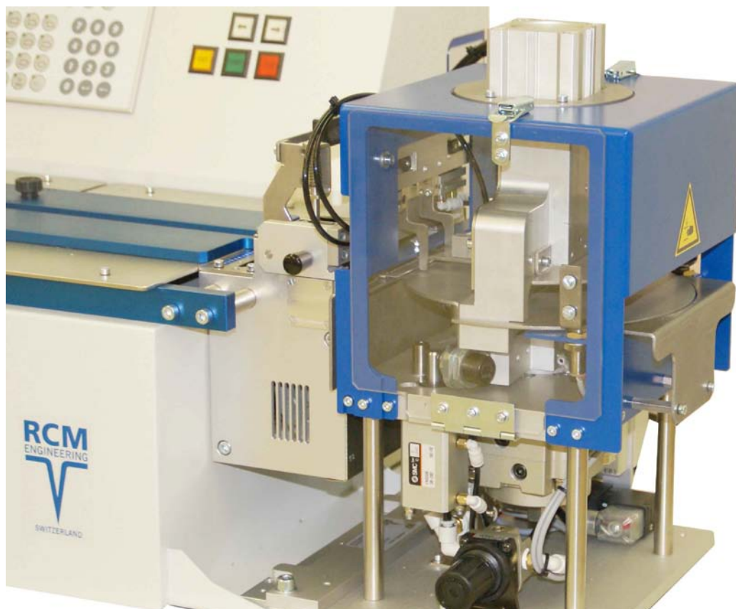
Guillotine 108 mm gerader Schnitt