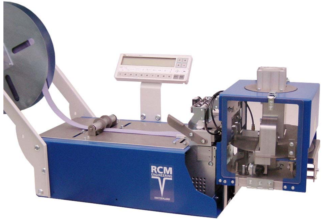
Guillotine 108 mm gerader Schnitt

tc-207-GU-DA / gerade-schräg-automatisch