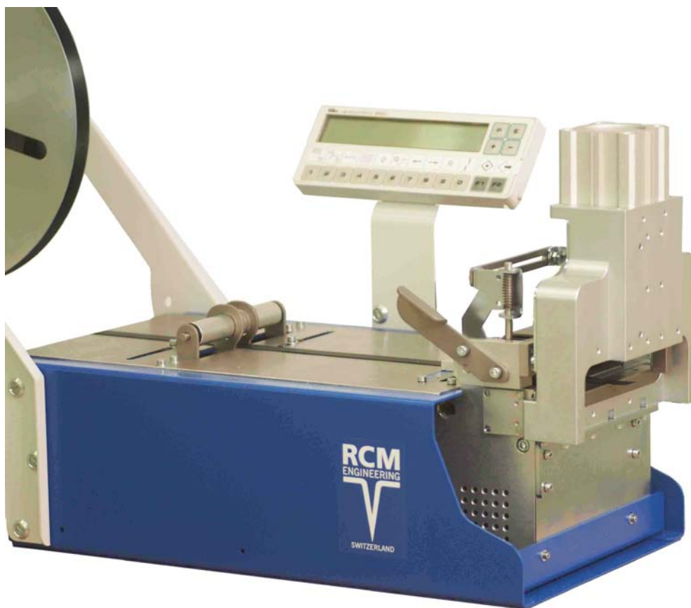
Guillotine 110 mm gerader Schnitt